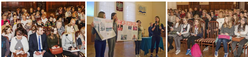
Migawki z konferencji

Młodzież gimnazjalna skorzystała jak widać, z wiadomości w Internecie (signum temporis) i wybrała zgodne ze swoimi obserwacjami i spostrzeżeniami. Tytułując plansze BABCIA i DZIADEK wskazała na istotny element łączności z seniorami poprzez więzy rodzinne. W wypowiedziach najwyraźniej został podkreślony fakt zmiany funkcji rodzinnych babci i dziadka oraz zmiany ich wizerunku i aktywności. Niewątpliwym odkryciem poszukiwań młodych ludzi były ekstremalne osiągnięcia seniorów w różnych dziedzinach, chociaż zauważali również, że otoczenie hamuje i pragnie ograniczać seniorów uwagami typu: „nie szalej”. Jeden z wyczynów miał miejsce w naszym regionie. To ważne, bo przekonuje młodzież, że wokół nas są niezwykle starsze osoby, może nie aż tak ekstremalnie, ale z pewnością możemy na ulicy mijać wspaniałych starszych ludzi, nie wiedząc o tym.