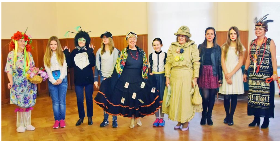
Modelki od lewej: kwiatowa pani, wzorowa uczennica, pajak, równa dziewczyna, cyganka, uczennica, papierowa pani, młodzieżówka, panienka, Indianka